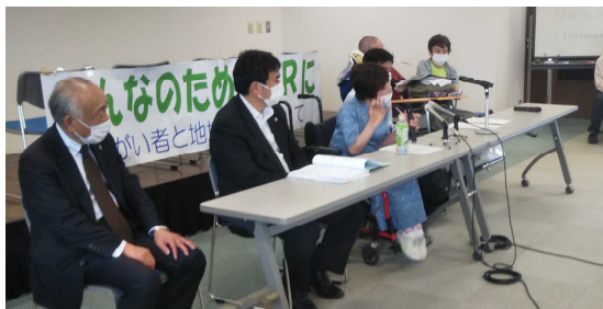
（写真は報告会 2021年5月13日）

報道関係者との質疑のなかで、原告から「車いすを利用する障がい者はいろんな状態があり、それに合ったいろんな配慮が必要だが、それがJRはできていない」「電話予約は縛りになる。ヘルパーに頼む場合でも、ヘルパーのいる時間は限られている。予約したあとも、その通りに動けないこともある。これまで